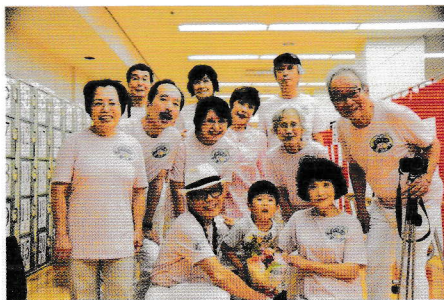
当館の敬老週間催事出演のメンバー