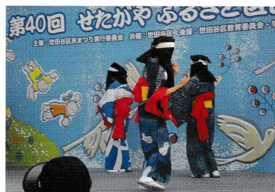
中庭の催事(昨年の様子)