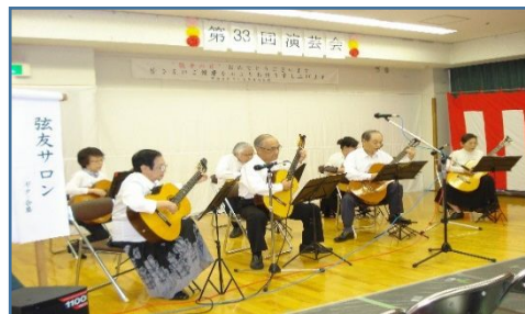
演奏中の弦友サロン