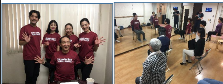
「座タップ」のスタッフと練習風景