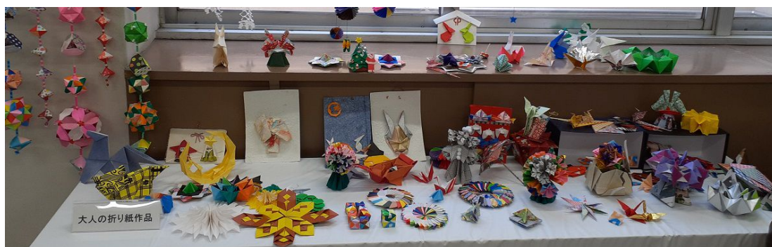
大人の折り紙作品